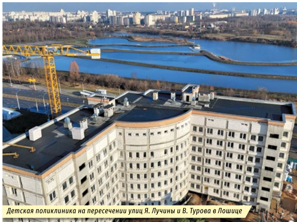
Детская поликлиника на пересечении улиц Я. Лучины и В. Турова в Лошице

школы в Смолевичах, объекта здравоохранения по ул. Маяковского, 31 и других.