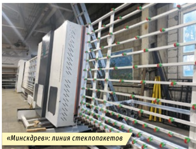
«Минскдрев»: линия стеклопакетов

«Метрострой» приобретен вибропогружатель для погружения свай в различные типы грунтов, а также буровая установка для устройства буронабивных свай.