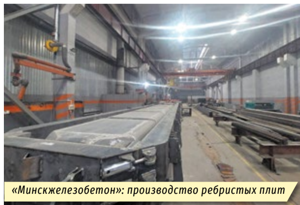
«Минскжелезобетон»: производство ребристых плит

ческое оборудование для производства профилей для устройства каркасов подвесных потолков, перегородок и других конструкций. УП «МИНСК-