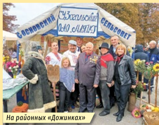
На районных «Дожинках»

Сама деревня Загалье тоже преобразилась. Реконструированы Дом механизатора и животноводства, здание администрации хозяйства, появились новые молочно-товарный комплекс и телятник-питомник на 150 голов, кормохранилища, построены пять современных жилых домов усадебного типа, заасфальтированы улицы. Сейчас строители ремонтируют старый жилищный фонд с заменой печного отопления на твёрдотопливные котлы. Развивать своё хозяйство МАПИД намерен и далее.