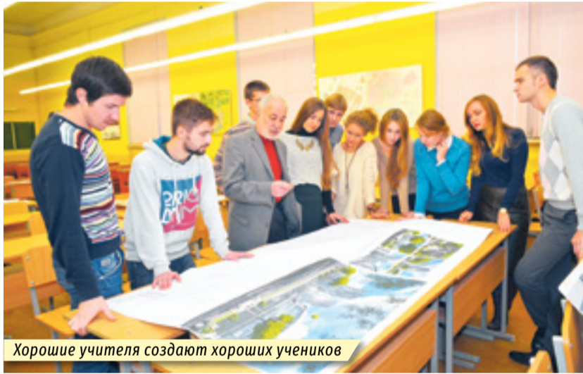
Хорошие учителя создают хороших учеников

Целый исторический пласт – 30-е, предвоенные. Творчество Иосифа Лангбарда: здания Дома правительства, Дома офицеров, Академии наук, Национального театра оперы и балета... Один из выдающихся зодчих Европы прошлого столетия на многие годы предопределил облик Минска. Прикоснитесь к его творчеству, взгляните в здания, которые современники