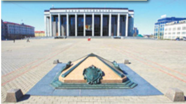
Начало начал: «Нулевой километр Беларуси»

ми и благоустроенными берегами вдоль Свислочи.