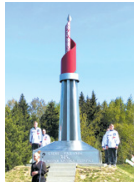
«Сцяг Радзімы» – высшая точка Беларуси

Студенты выполняют художественные работы для наших городов и сел, предприятий. В прошлом году, например, создали 20 оригинальных муралов, украсив ими столичные подстанции. Инженерные сооружения получили иное звучание.