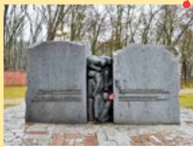
Фрунзенский район Памятник жертвам Минского гетто (урочище Цагельня)