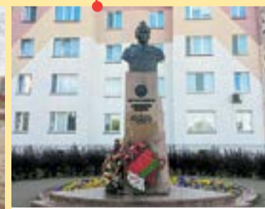
Октябрьский район Памятник Герою Советского Союза Джумашу Асаналиеву