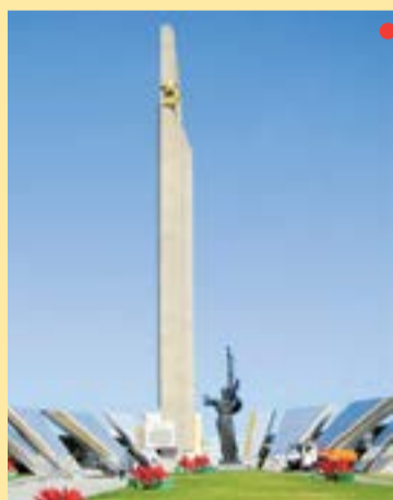
Центральный район Стела «Минск – город-герой»

Спасибо вам, что мы войны не знаем, За теплый цвет сиреневой весны, Добытый кровью в том победном мае, От всех от нас, не видевших войны, Спасибо вам, что мы ее не знаем.