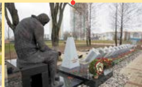
Московский район Мемориал «Память»