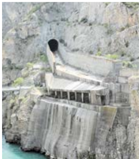
Штольни в отвесной скале строил ТО-1

землетрясение, вошедшее в историю как Дагестанское. Трясло так, что строители были вынуждены срочно эвакуироваться.