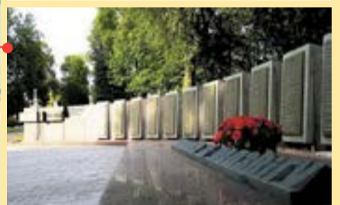
Советский район Братская могила погибшим в годы войны