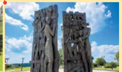
Заводской район Мемориальный комплекс «Тростенец»