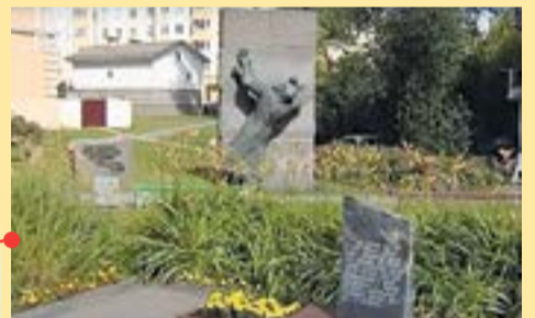
Первомайский район Мемориал узникам «Шталага-352»