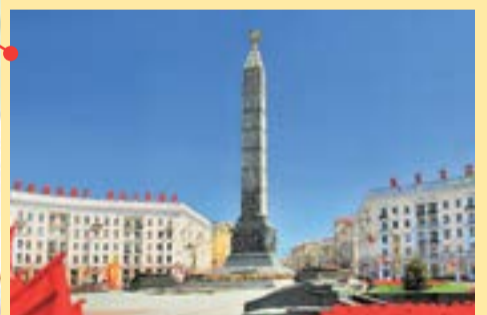
Партизанский район Площадь Победы