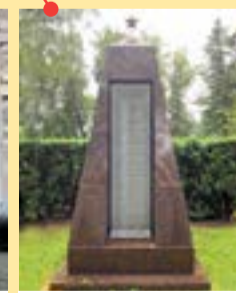
Ленинский район Воинское захоронение