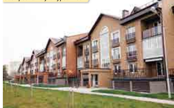
Застройка на ул. Курганной

тальной застройки «Солнечный». Строим здесь жильё за свои средства, не привлекая средств граждан. Вложили большие