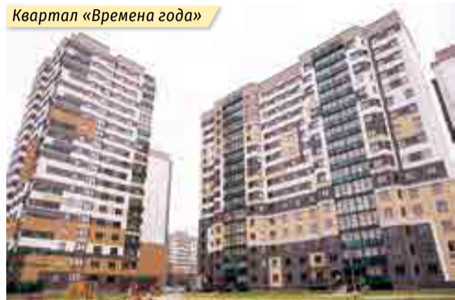
Квартал «Времена года»

лучили той прибыли, которую должны были получить и направить на модернизацию производства. А планы по модернизации были большие. Принятые впоследствии управленческие решения на уровне Правительства по регулированию цен на строительные материалы несколько стабилизировали ситуацию.