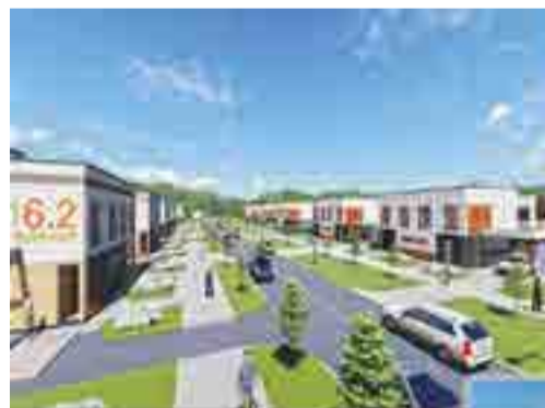
Застройка микрорайона Северный в г. Минске

Программа строительства жилья на 2023 год находится в разработке и будет уточняться, но предварительно могу сказать, что в конструкциях МАПИДа в целом пла-