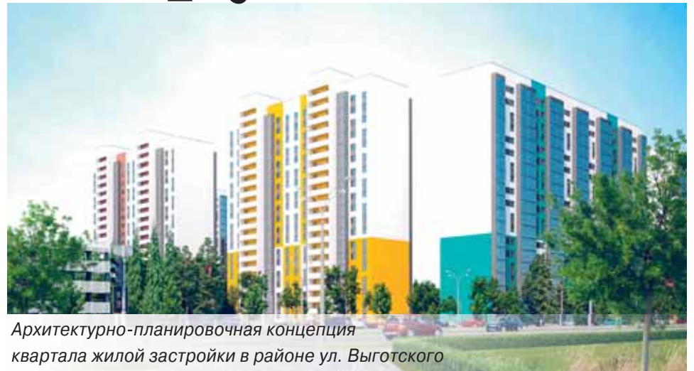
Архитектурно-планировочная концепция квартала жилой застройки в районе ул. Выготского

При проектировании застройки на Филимонова-Столетова основной упор делается тоже на серию 24-РС Завода эффективных промышленных конструкций. Строительство жилья будет осуществляться исходя из мощностей ЗЭПК. Вначале планируем построить два жилых дома (№3.2 и №3.3 по генплану) на свободной от сноса площадке. Акты выбора земельных участков уже получены. Один из них, двухсекционный 19-этажный, предназначен для отселения жильцов (выделяется