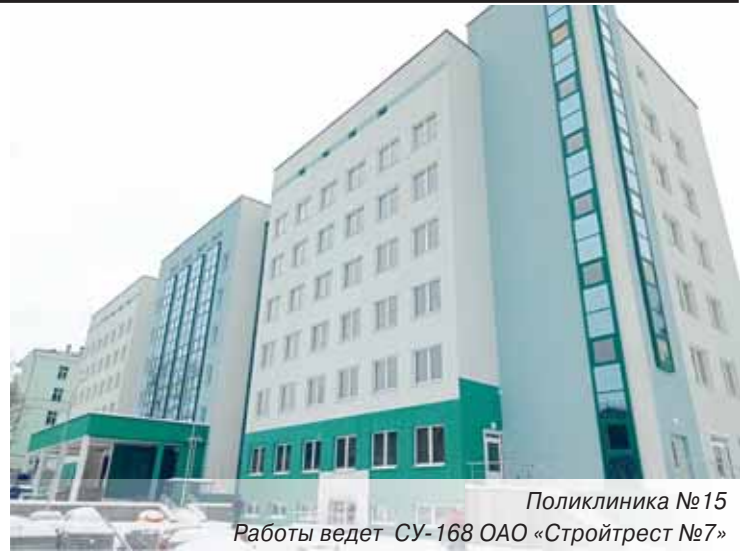
Поликлиника №15 Работы ведет СУ-168 ОАО «Стройтрест №7»

На вводных объектах здравоохранения работает стройтрест № 1 – детской поликлинике в Сухарево, новом хирургическом корпусе на территории РНПЦ «Кардиология», поликлиническом корпусе Минской районной больницы в Боровлянах. У стройтреста № 7 на завершающей