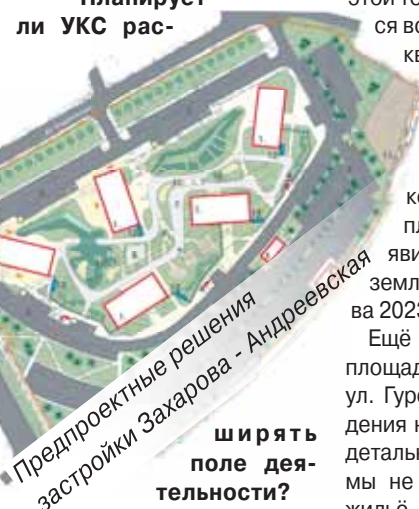
Предпроектные решения застройки Захарова - Андреевская