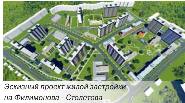
Эскизный проект жилой застройки на Филимонова - Столетова

щадки на Выготского в том, что она должна быть интегрирована в проект комплексного освоения территории «Северный берег» иностранным инвестором. Нам предстоит взаимодействовать инженерно-транспортную инфраструктуру с учетом общего развития этой части Минска.