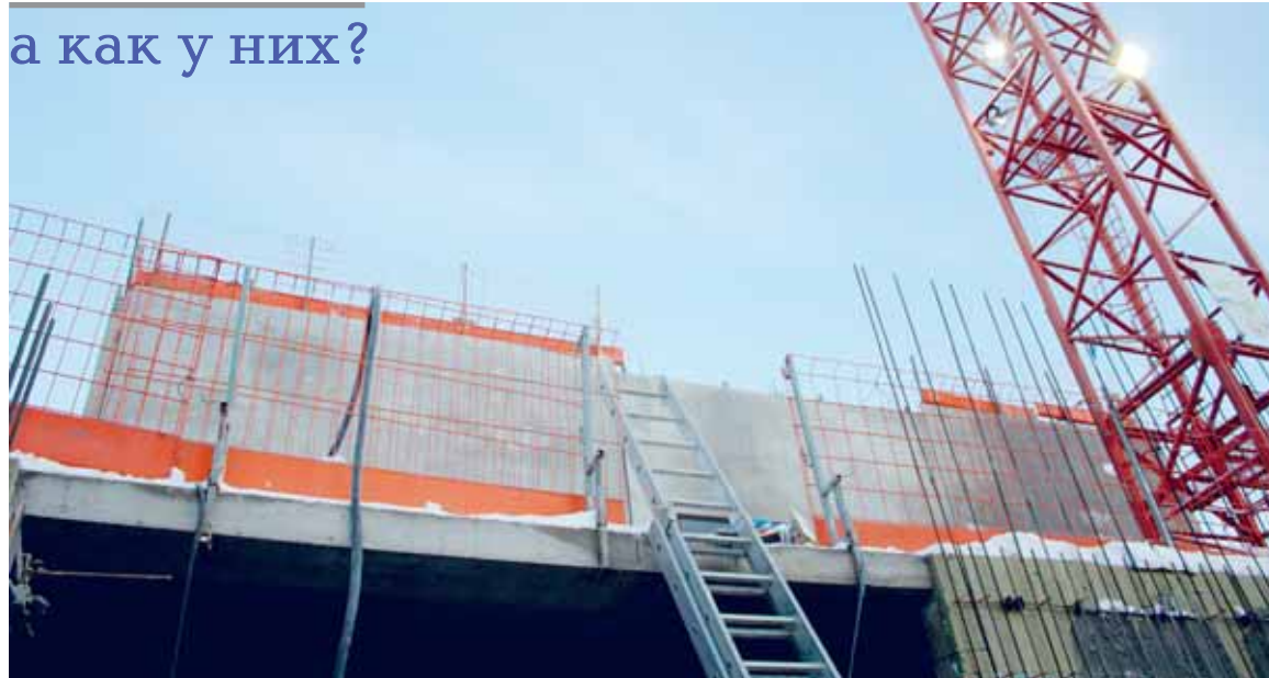
а как у них?

Белорусская делегация смогла попасть на объект финской компании N после прохождения теста на алкоголь, вводного инструктажа и облачения в жилеты, каски, спецобувь. Очки оказались лишними, но, просмотрев по сторонам, стало понятно, что здесь так работают. Сразу бросается в глаза разграничение движения транспорта и пешеходов. Нам пояснили, что появились оно после гибели строителя – вот уж поистине правила ОТ написаны кровью.