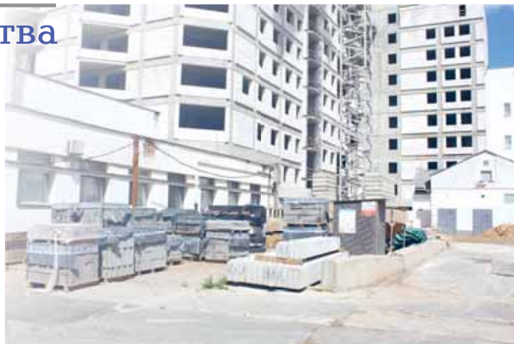
Строительство корпуса РНПЦ «Кардиология» – генподрядчик ОАО «Стройтрест № 1»

сты отдела осуществляют выезд на стройплощадки, inspecting не только саму стройплощадку, но и прилегающую территорию. Обращается внимание на складирование материалов, своевременный вывоз мусора, наличие