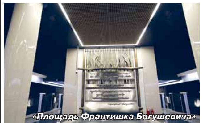
«Площадь Франтишка Богушевича»