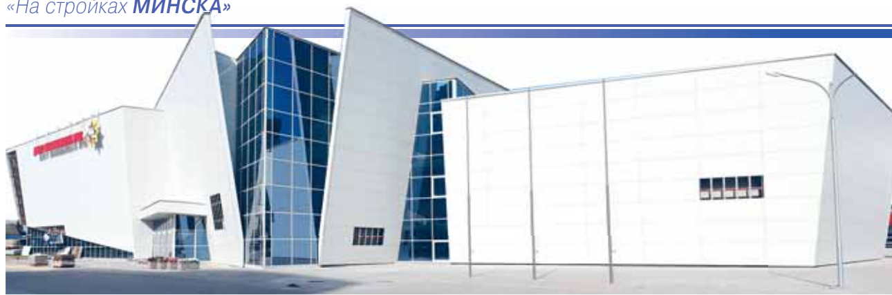
На вводных объектах