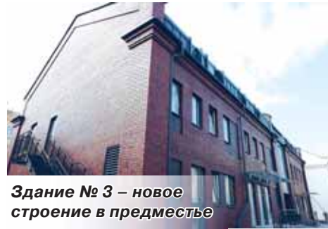
Здание № 3 – новое строение в предместье

Совсем скоро в отреставрированные корпуса бывшего хлебозавода заселятся арендаторы, и жизнь в этом уголке Раковского предместья снова заурлит. Откроются объекты торговли, общепита, досуга, образовательные и др. Запах ароматного хлеба и свежей выпечки будет витать над Раковским предместьем как и прежде, напоминая нам об истории этого уникального места.