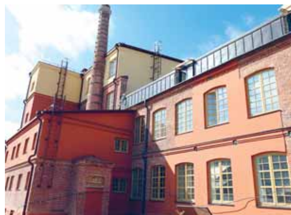
Здание № 1 — доминанта в застройке Раковского