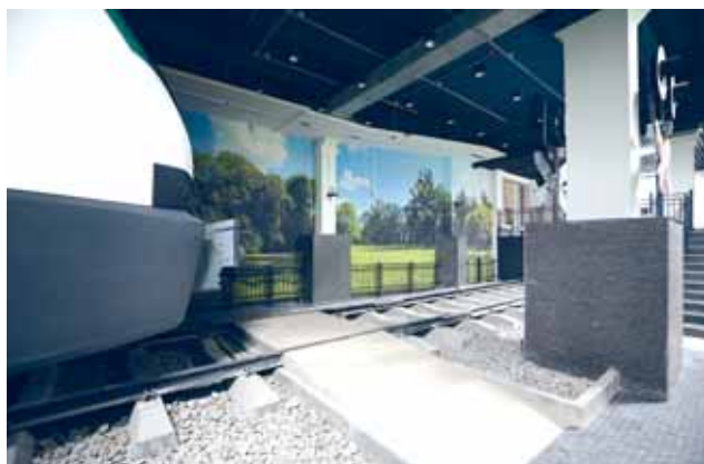
МАТЕРИАЛЫ ПОЛОСЫ ПОДГОТОВИЛА НИНА ЦЫКУНОВА