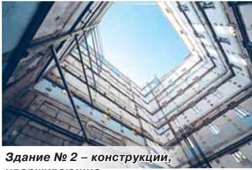
Здание № 2 – конструкции, удерживающие вековые стены силоса

Закончены также внутренние отделочные работы и реставрация фасада здания № 1 – доминанты застройки. Этот корпус хлебозавода полностью сохранен, отреставрирован фасад – историческую кирпичную кладку не закрывали штукатуркой, ее оста-