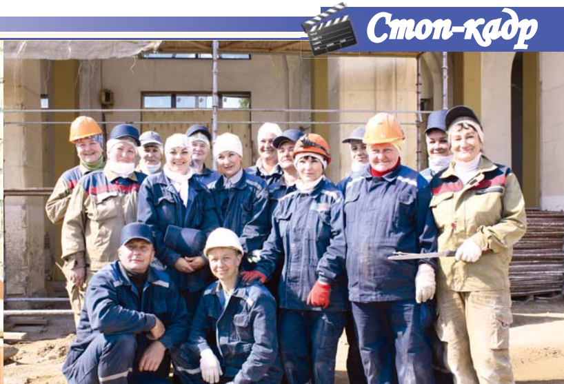
Лучшие изолировщики ЗАО «Минсктермоизоляция»