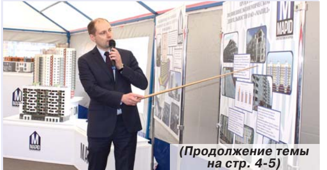
(Продолжение темы на стр. 4-5)