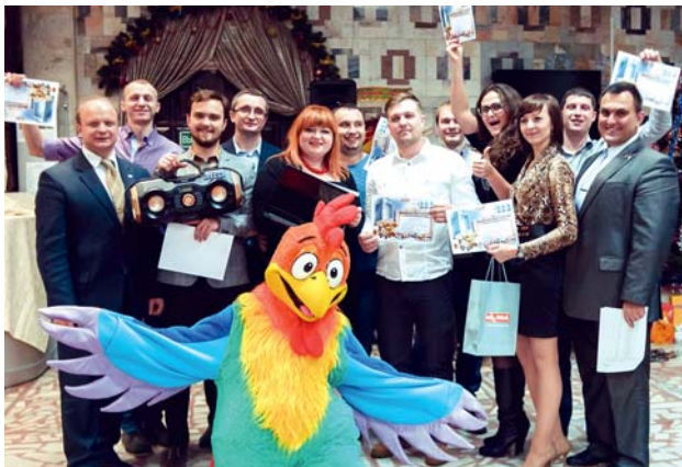
Удачи — лидерам!