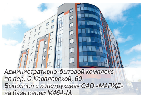
Административно-бытовой комплекс по пер. С.Ковалевской, 60. Выполнен в конструкциях ОАО «МАПИД» на базе серии М464-М.