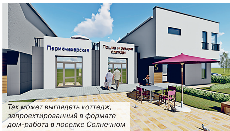
Так может выглядеть коттедж, запроектированный в формате дом-работа в поселке Солнечном

МАПИД включится в работу. Интересное решение в формате дом-работа предлагают проектировщики и ОАО «МАПИД» для застройки поселка Солнечный. К слову, для отопления, горячего водоснабжения и приготовления