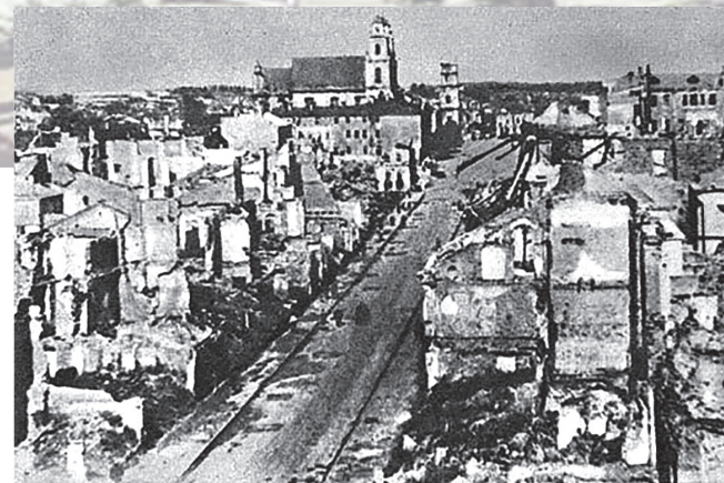
Разрушенный войной Минск