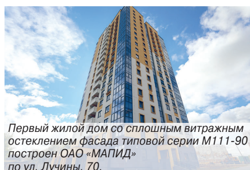
Первый жилой дом со сплошным витражным остеклением фасада типовой серии М111-90 построен ОАО «МАПИД» по ул. Лучины, 70.