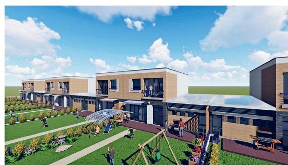
Свой оригинальный взгляд на застройку микрорайона Северный предлагает проектное управление ОАО «МАПИД» — это не только комфортное жилье, но и современная организация прилегающей территории.