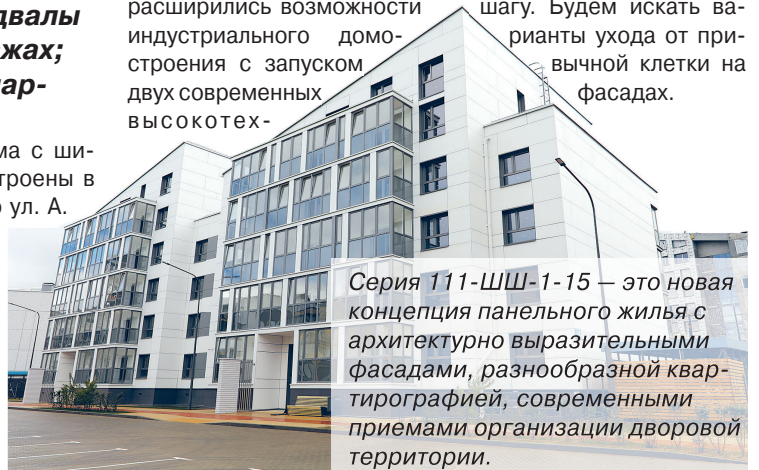
Серия 111-ШШ-1-15 — это новая концепция панельного жилья с архитектурно выразительными фасадами, разнообразной квартирографией, современными приемами организации дворовой территории.