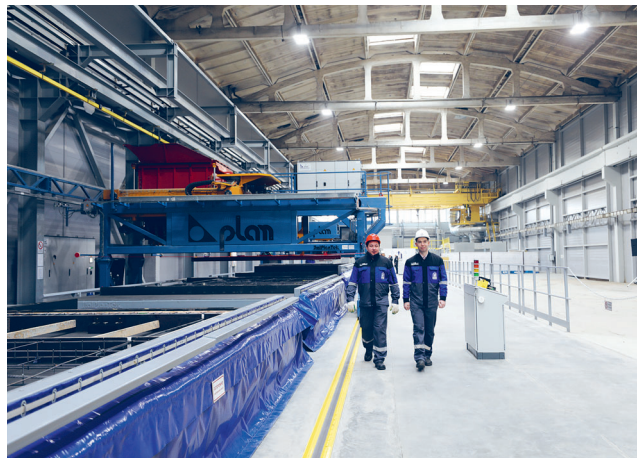
Линия, по сути, универсальная. Здесь можно изготавливать все слагаемые жилого дома