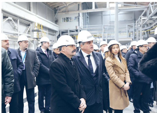
В ходе импровизированной экскурсии участникам мероприятия было предложено ознакомиться с работой линии по производству железобетонных изделий

Система тепловой обработки представлена на заключительном стенде, сверху и по периметру закрытом тентом. Под изделием, на уровне пола смонтирована система ребристых труб, по которой циркулирует горячая вода от 40 до 70 °С. Температура контролируется тремя датчиками, расположенными в разных зонах стенда, с воз-