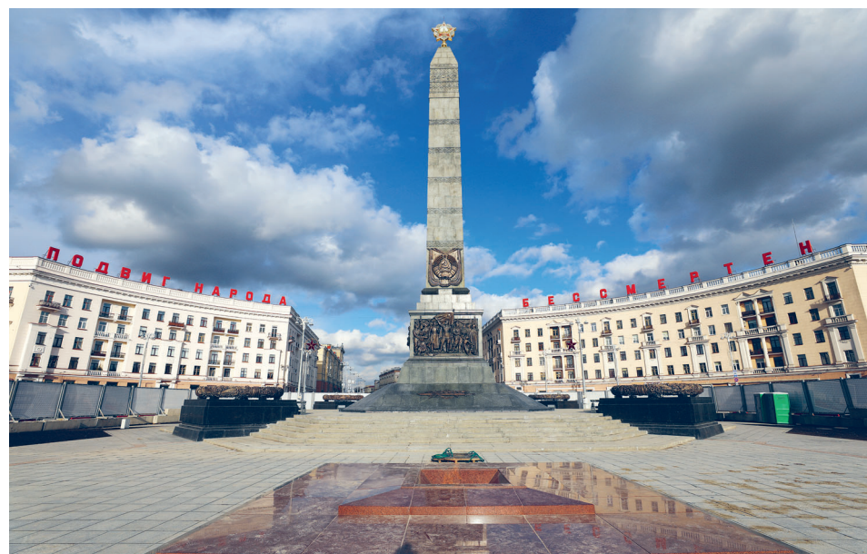
Заказчиком по реконструкции площади Победы выступило ГПО «Горремавтодор Мингорисполкома», генпроектировщиком — УП «Минскинжпроект». Проект реализован управлениями ОАО «Стройтрест № 1» (СУ-19, СУ-67, СУ-4 и УСР).

Разумеется, реставраторы серьезно поработали над стелой обелиска. Заметно, что камень стал фактурнее. Каждая плитка подвергалась чистке с помощью специальных химреагентов, при наличии высолов — накладывались