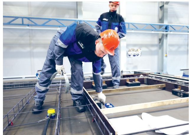
В процессе сборки изделия крепятся каналы электропроводки и электромонтажные пластиковые коробки

Мы имеем почти 30-летний опыт работы на рынке и готовы к реализации амбициозных проектов.