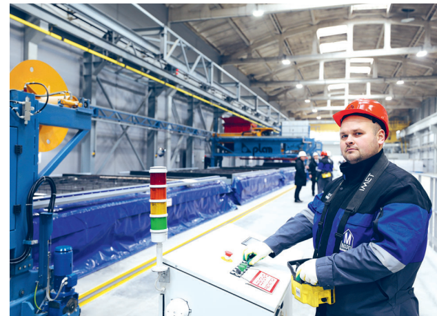
Адресная подача бетона — это, в первую очередь, скорость без потери объемов и качества