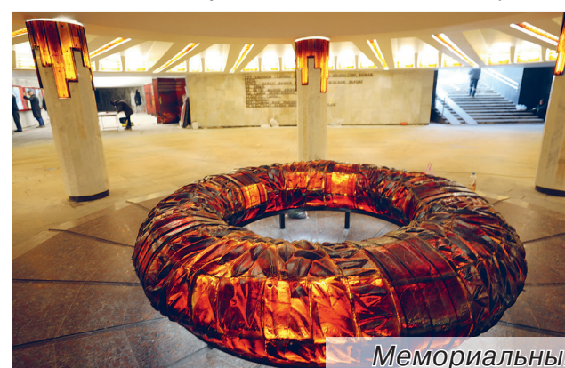
Мемориальный зал (нижний уровень площади Победы)