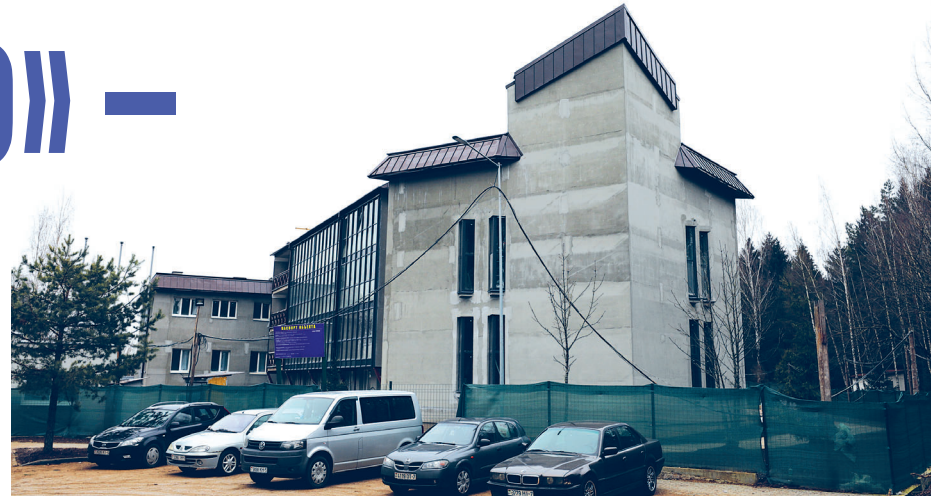
Ввод в эксплуатацию дома-интерната для пожилых людей намечен на второй квартал 2020г.