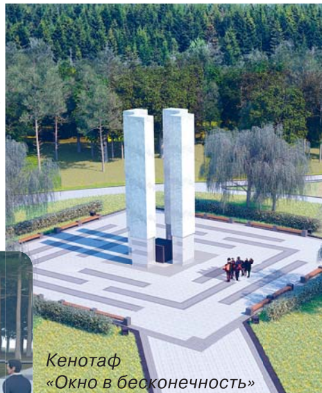
Кенотаф «Окно в бесконечность»

тяженностью 2,5 километра, где запроектирована пешеходная связь с мостом над Могилевским шоссе. Добраться по ней до Благовщины можно будет и на малогабаритном транспорте.