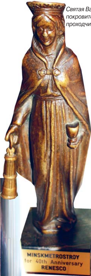
Святая Варвара – покровительница проходчиков