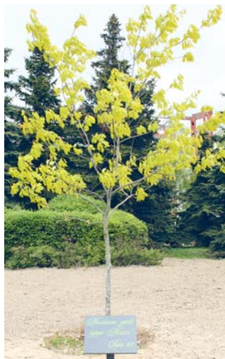
Миллионное дерево г. Минска. Апрель, 2017

новогодние и другие праздничные гуляния (в центре предусмотрена установка елки и сборно-разборной сцены). К середине мая на обновленной территории свое место займут малые архитектурные формы – скамейки и урны нового дизайна. Благодаря строителям парк стал красивым и ухоженным. В будущем его ждет еще третья очередь реконструкции – набережной и самой реки Мышки с устройством станций водоподъема, фонтана, новых мостиков.