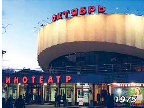
«Октябрь» открылся 30 января 1975 года премьерой фильма «Блокада». Проект кинотеатра — дипломная работа солиста ВИА «Песняры» Леонида Борткевича.

Павильон Комаровского рынка размером 103х103 метра перекрыт (без единой колонны!) пологой сборно-монокрильной оболочкой полой кривизны, опирающейся по контуру на стойки с шагом 6 метров