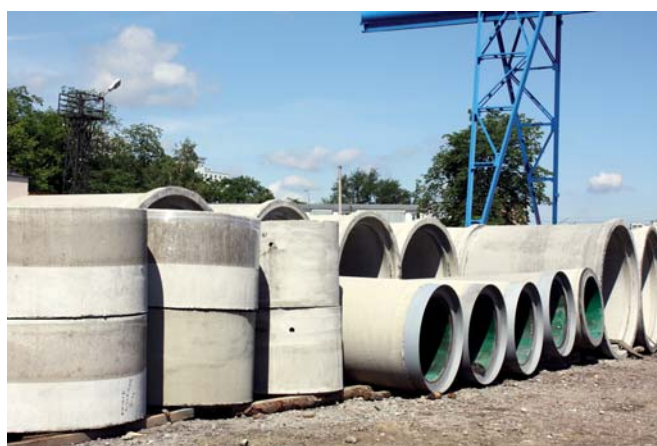
Микротоннельные трубы с защитной оболочкой, производимые в УПТК треста № 15 «Спецстрой», названы лучшей продукцией 2017 года по итогам конкурса «Лучшие товары Республики Беларусь».

под создание новых рабочих мест площади на льготных условиях. Готовы и по другим направлениям оказывать поддержку, чтобы минских предприятий-победителей в этом конкурсе становилось