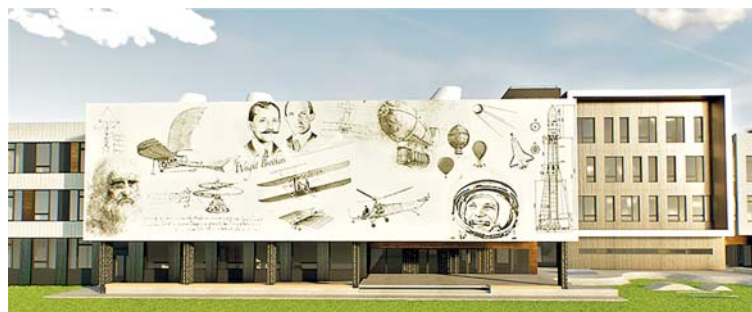
Визуализации школы будущего в Новой Боровой