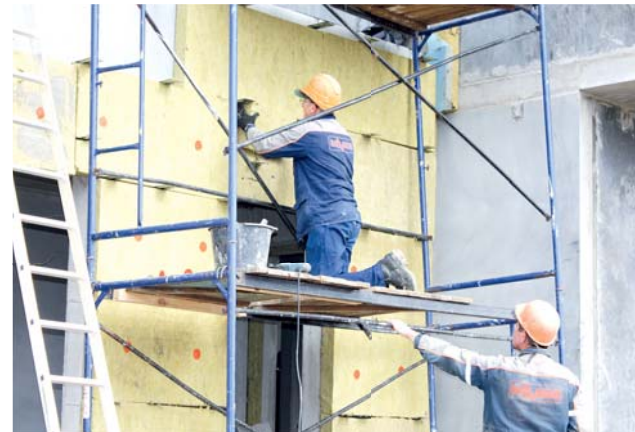
Утепление фасада второго коттеджа проекта «Минский дуэт»

Мапидовцы обещают, что уже ко Дню строителя все три выставочных образца современных коттеджей с выполненной внутренней отделкой бу-